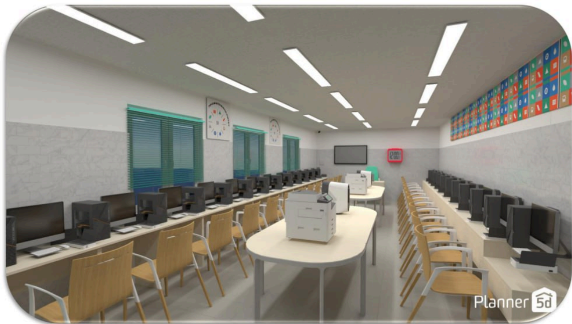
Визуализация зоны под вид работ «Кассир билетный»