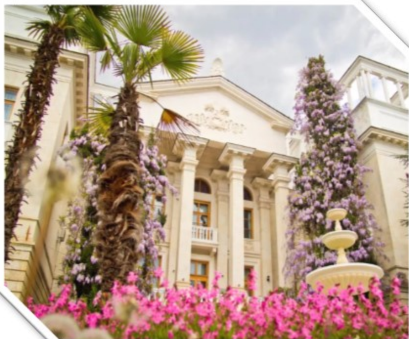
ГУПРК СОК «РУССИЯ»