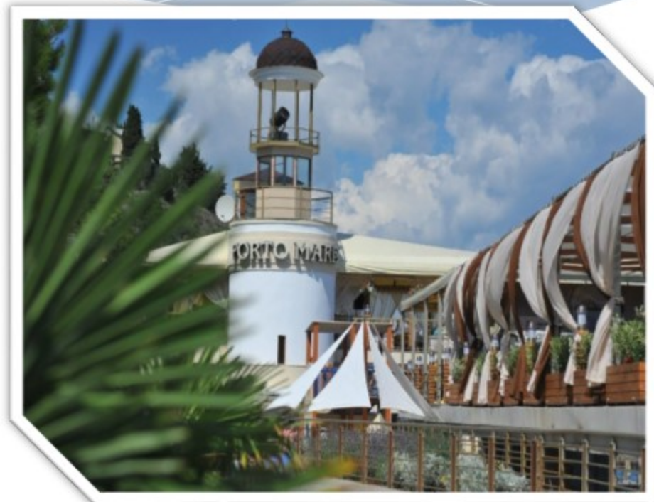
ПАРК - ОТЕЛЬ «PORTO MARE»