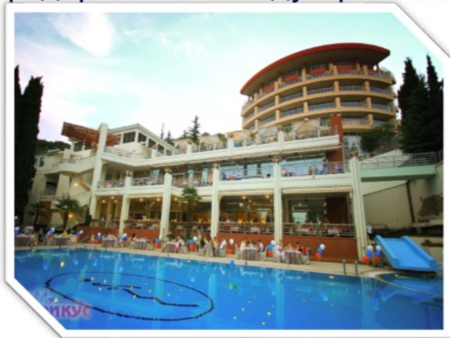
АО «Пансионат «МОРЕ»

Заключено более 100 договоров о сотрудничестве с ведущими предприятиями индустрии гостеприимства Крыма.